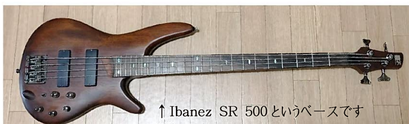
↑Ibanez SR 500というベースです

昔アコギを弾こうとして1か月で挫折した経験があるので不安ですが、意外とベースの方がエレキギターに近い感覚で弾けます。馴染みの楽器店に行ったとき、中古で売られていたこのベースに一目惚れして購入しましたが、比較的軽くて細いベースで、手が小さい自分でも弾きやすいです。いつかドラムやキーボードも練習して、1人バンドのようなこともやってみたいですね。