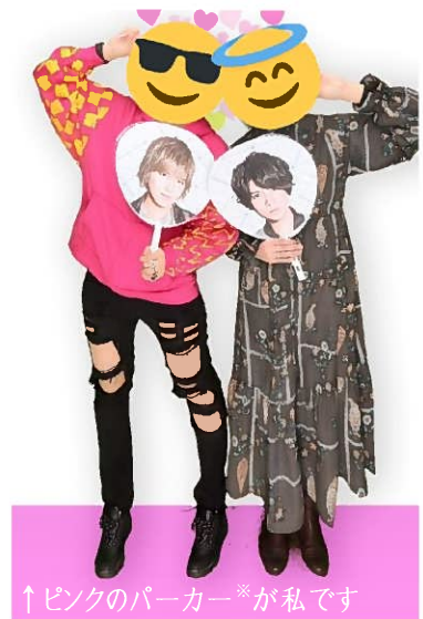
↑ピンクのパーカー*が私です

※至る所にツアー頭文字Wがプリントされたトーチキデザインなため巷では大草原パーカーと呼ばれている