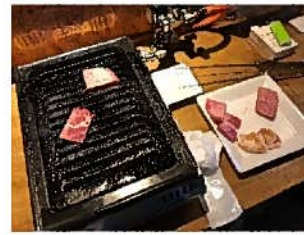
肉1枚に思いを込めて焼きます→

すね。ちょっと食べたいとき、がっつり食べたいときどっちもいけます。大人数は難しいけれど、一人でも入れてお勤めです。