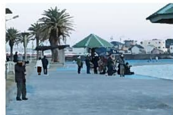
▲スタンバイ中の人たち