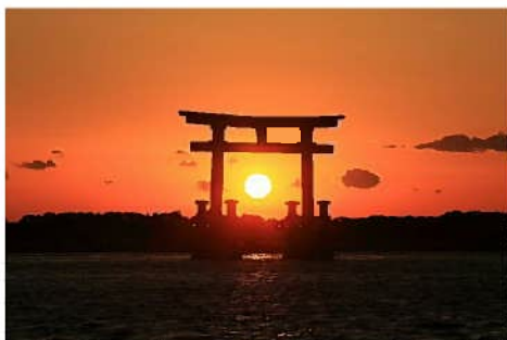
▲晴れた日にはこんな光景が…