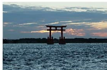
▲曇りの日の残念な写真