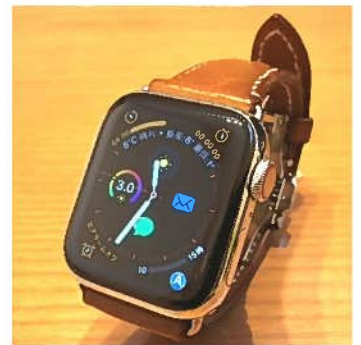
↑ベルトは別購入で皮革製に変更しました

スマートフォンと連動するデジタル腕時計「スマートウォッチ」。iPhoneを使っているので、Apple Watch Series4(2018年9月発売)を購入しました。スマートフォンは多機能で常に身に付けて使う製品ですが、我慢できなかったことがあります。「ポケットに入れていると、でかくて邪魔だし、膨らんでカッコ悪い」。そのようなわけで、スマホと連動して動作するスマートウォッチに興味を持っていました。実際に使ってみてスマートウォッチは機能面でも少なからず生活が改善されたように感じます。