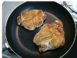
鶏肉から出てきた油は捨ててて両面焼いたら出来上がり

バナナの保管に便利なのがこちらのアイテム「バナナツリー」。バナナは接地している底面がいち早く痛んでくると言われています。バナナツリーを利用すれば宙に浮くので痛みにくいというわけです。特に夏は熟するのがとても速いので本アイテムが効果を発揮します。でもなくても全然困りません。食べごろサインであるシュガースポット(茶色のぷつぷつ)が出てきたら、冷蔵庫の野菜室に放り込んでしまえばよいのです。熟すスピードはゆっくりになり痛みにくくなります。ただし、冷蔵庫に入れると皮の色が全体的に茶色く変色します。見た目は悪いですが可食部は無事です。