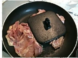
ミートプレスをずらしながら弱火でゆっくり皮目を焼き上げます