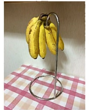
写真はモンキーバナナ

バナナの保管に便利なのがこちらのアイテム「バナナツリー」。バナナは接地している底面がいち早く痛んでくると言われています。バナナツリーを利用すれば宙に浮くので痛みにくいというわけです。特に夏は熟するのがとても速いので本アイテムが効果を発揮します。でもなくても全然困りません。食べごろサインであるシュガースポット(茶色のぷつぷつ)が出てきたら、冷蔵庫の野菜室に放り込んでしまえばよいのです。熟すスピードはゆっくりになり痛みにくくなります。ただし、冷蔵庫に入れると皮の色が全体的に茶色く変色します。見た目は悪いですが可食部は無事です。