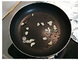
ニンニクを炒めて香りを出します

肉を焼くときに便利なのがこちらのアイテム「ミートプレス」。例えばチキンステーキ(チキンソテー)を作る際使えば、あの「ぱりぱりチキン」が簡単に作れます。仕組みは簡単です。重量が1Kg以上あるミートプレスが鶏肉を押さえつけることでフライパンに密着し皮目がしっかりと焼き上げられます。普通に焼いたのでは鶏肉は凸凹しているので焼きムラができてしまいます。全体がぱりぱりになりません。でもなくても全然困りません。ネットで調べればわかりますが、キッチンシートやアルミホイルを敷いて上から水を入れた鍋やかんを置くという方法で代用できるそうです。