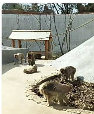
サル近いよ！ 迫力ありますね

今もまだまだ至る所で工事中なので、これからもどんどんパワーアップしていくのではないのでしょうか。