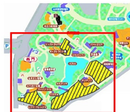
園の西門側は3月現在工事中多いです