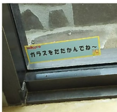
こんなユニークな注意書きも(笑)