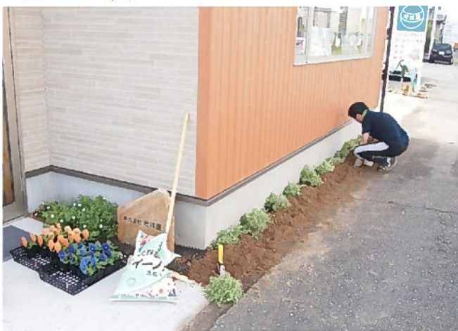
青とオレンジのパンジー

土壌を整えて、いよいよ花を植えてみました。秋からはパンジーとビオラの季節です。色取り取り、華やかに咲いてくれることを願って…。