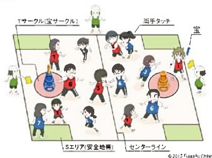
イメージイラスト

頂いた名刺は会社の共有財産ですので、誰が頂いた名刺であっても社員全員が見られるようにしておきましょう。パソコンの専用ソフトを使えば、簡単に登録も社内共有もできます。また、スマートフォンへの名刺データ転送機能も付いていますので、いつでもどこでも名刺が確認できます。スマートフォンなら地図で住所確認もできますし、GPS 機能で道案内までしてくれます。無駄な「探す」「調べる」時間はかなり減らせますし、値段も安いのでおすすめです。(毎度ですが、詳細は竹本までご連絡ください)