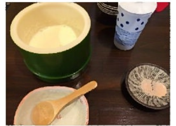
寄せ豆腐 ↑ (その場で作るよ、温かい)