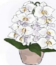
趣味はお絵描き (パソコンで描きました)