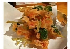
桜えびと三つ葉の かき揚げ天→