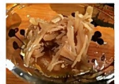
自家製 なめ茸おろし→