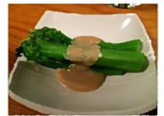
アスパラ菜と 自家製ごまだれ→