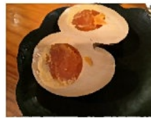
← 茹で卵の 味噌&麹漬け