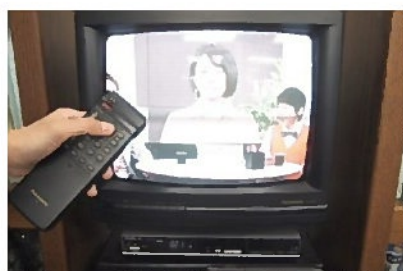
元気を取り戻しました！

30分ぐらいしてから、あきらめきれずに、コンセントを入れ直して、しつこく再度スイッチをONしたところ、何といつものように普通に見る事ができました。