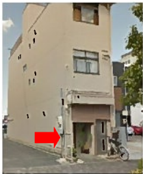
(Google ストリートビューより)

隠れた名店というのは言葉では良く聞けれど、こんなに隠れていて良いの？こちら 正面から見ないとお店と気づかないし正面から見ても店名しか書いてないから飲食店と気づかないかもしれない、そんな「一宙(イチチュウ)」さん。知っている人しかこないよね？？と不思議に思ってしまった。