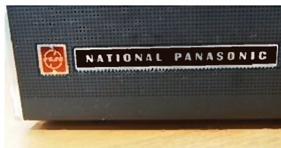
Panasonicブランドは50年前から健在です！

こんなに持ちの良い製品が復活したら、日本の経済は成り立たないかも知れないが、ゴミのない世の中になって無駄のない超省エネの美しい地球社会になるのにと勝手に思い込んでいます。