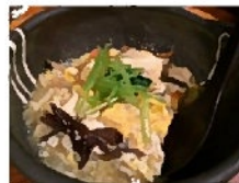
← 優しい味の 野菜の煮物 (山芋すりおろし入り)