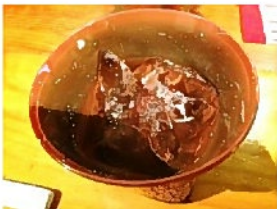
初めて飲んだ焼酎(ロック)。 妻と芋。まだ初心者だから妻の方は癖が少なくて飲みやすかったかな？ 芋焼酎は芋の味が濃いね。 ロックで頂きました。 ← 芋焼酎

訪問のきっかけはよく行く酒屋さん「栄屋酒店」の親父さんにウイスキー 飲んだことないのでグラスで飲めて料理の美味しいところを相談したこと。2回目の今回はまたしても 飲んだことのない焼酎の味を知るために。手作りの料理はその時々で異なるようです。次は予約してから来てね～って言われたから予約したら気合い入れて料理を用意してくれるのかな？