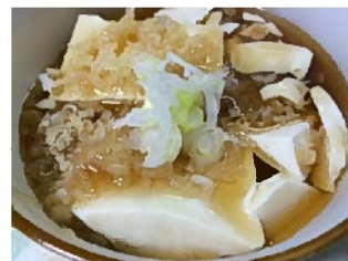
揚げてないけど揚げだし豆腐(風) 揚げてないのに揚げだし豆腐とは…… 乗っけることで それっぽく時短 酒もうまい