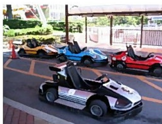
ゴーカート 1人乗り用2人乗り用あります