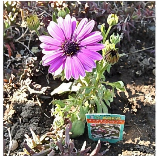
オステオスペルマム

うーん、植えてしまってから庭植えには向かない事を知りました。自分に都合の良いように考えて植えましたが、ちょっと甘かったかな？でも、精一杯咲かせて見せます。