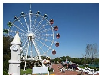
観覧車 上からの眺めは絶景です