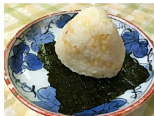
天かすのおにぎり 天つゆ と 天かす う〜む、これは天むすだ！