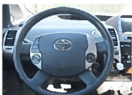
使われていないボタンが多い

パソコンを上手に快適に使うには、ちょっとした工夫が大切です。処理速度を上げるためには不要なソフトを減らしたりメモリーを増やせば、快適になります。