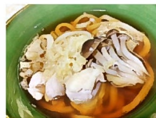
定番のうどん 天ぷらなくても天ぷらうどん(気分)