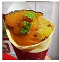
さつまいもをトッピング 美味しそう♪