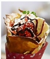
ふっくらもちもちした 生地が美味しい！

お店で買ってる時、60代のおじさんが産まれて初めて食べたけれど、食べてみたらうまいもんだね！ボリュームもあってこりゃあいいわとお客さんが言ってました。