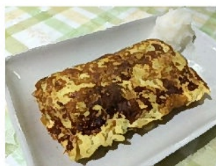
天かすの出し巻き卵 さくっとした食感がやや残り美味