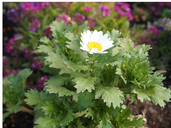
厳しい寒さの中にも負けず 小さくてもたくましく咲き続ける ノースポール

晩秋に植えた花が寒さに負けて枯れてしまったけれど竹本がもらってきたノースポールを植えてみました。こんな寒い日の中でも丈夫に育ちました。毎日、土が凍って植えられなかったので1週間ぐらい外に放置していました。余りの寒さが続いたので半分あきらめていましたが、折角持ってきてくれた花なのでダメ元で植えてみました。パンジーも枯れて行く中、ノースポールだけは元気に育っています。丈夫な花はたくましいです。花も葉も凜として寒さにも負けませんシャキッとしています。この花を見て、私達も地球屋もこんな寒さなんかには負けておられません。