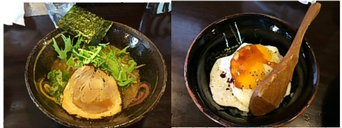
ランチで食べた ↑ 「の一まる」(しょうゆ)

い！でも悔しいのが1度の訪問ではすべての味を試せないこと！ 食べたいものが多すぎて。まんまる堂さんへは高速道路を使えば1時間ほど。射程距離ですね。ビールは飲めないけれど、うーん悩ましい。おなかすいた……。 (記事を書いているのはお昼の12時ちょっと前)