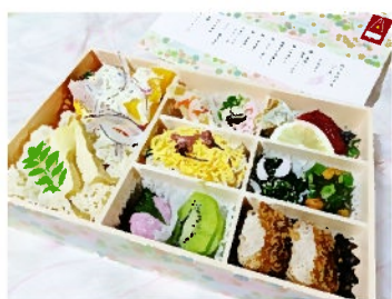
↑ 料亭女将弁当 「花舞」(¥2,160)

ました。レジで聞くと「一日2・3個の入荷ですね」。なんという少なさ。これは思わぬ超激レア級のアイテム。手に入れたお弁当は岡崎市の食事処「おぎ乃」さんが作る料亭女将弁当「つぼみ」と「花舞」。高い？けれどお値段に見合った内容だと思います。次のシーズンの弁当も楽しみですよ。(クーラーボックスで自宅に持ち帰り 呑みながら頂きました)