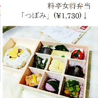
料亭女将弁当 「つぼみ」(¥1,730)↓

花舞 鱈の唐揚げ/梅肉ソースがけ/鱈の味噌カツ/法蓮草の胡麻和え/鱈のゼリー寄せ/鱈の春巻き/鱈の南蛮漬け/合鴨ロースのオレンジ釜/シラスの稲荷寿司/竹の子御飯/桜餅/キウイフルーツ