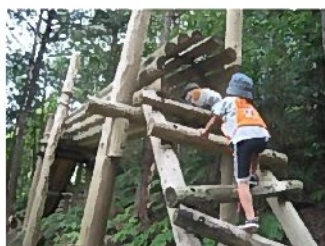
アスレチック写真