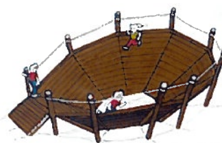
まん中に落ちないように、反時計回りに3周走る