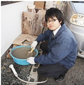
ボクはセメントをコネる係

納税する力がありませんので、市道も県道も事務所の廻りは自社でメンテナンスします。