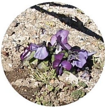
やはり、霜には弱いです