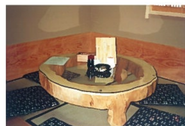
豊川市御油町の久寿しさん内にて