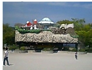
屋外にあるアスレチック