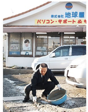
私は左官屋さんです

駐車場は県道と市道に挟まれていますので、通過する車から時々ゴミを捨てられます。毎朝、メゲずに草取りしながらゴミ拾いに挑戦しています。