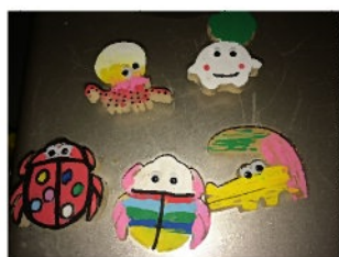
ペンで色塗りできるマグネット