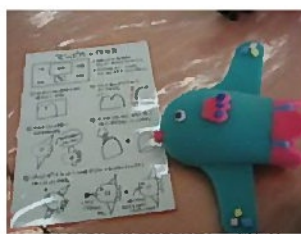
ウレタン工作で作れます