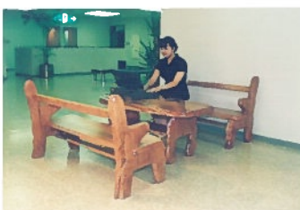
25年前の写真、この応接と机は今でも社内で現役です。