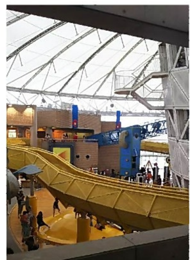
色々ありすぎて写真撮りづらい(笑)