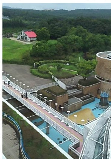
→ 展望台からの眺めは最高