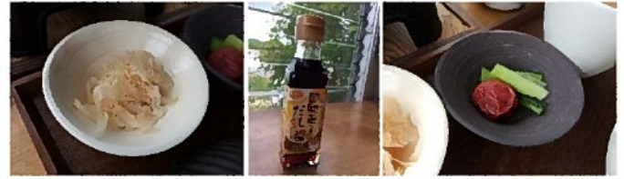
TKG 専用だし醤油 鶏ぶし(×鰹節)

お釜のご飯は思ったほど多くないので、茶碗に小盛にして卵を割り入れます。いつもより卵多めでちょっと？かなり贅沢感があります。たまごかけごはんでもこうも気分が高まることがあったかな？