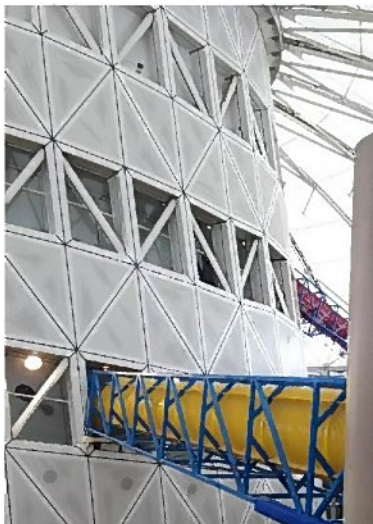
真ん中に見える塔を登ると

最近が一番上の子が小4で一番下の子がもうすぐ2歳と年齢差が大きいので、みんなが一緒に楽しめるところを探すのが大変ですが、ここはどの年代でも楽しく遊べそうでした。