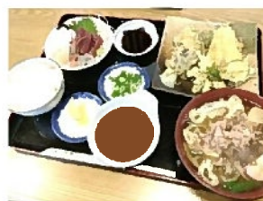
フキトウの野菜天

牡蠣フライも良かった。(訪問時は牡蠣のシーズン中だった)「当店は浜名湖丸缶を使用しています」の壁紙。丸缶?? ネットで調べるとそういう丸い缶に入った状態で売っているブランド? なんですって。ただならぬうまさだったよ。次のシーズンになったらどうぞ。