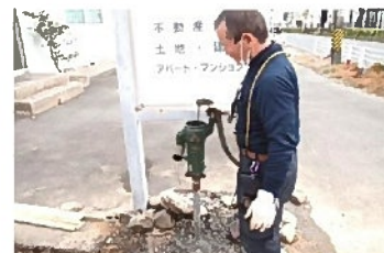
おおっ！出始めたぞ！

社内だけでなく、必要な時に常日頃大変お世話になっているご近所さんにも使って頂けたら幸いです。 水道工事屋の社長さん、早速水を出して頂いてありがとうございます。とても嬉しいです！