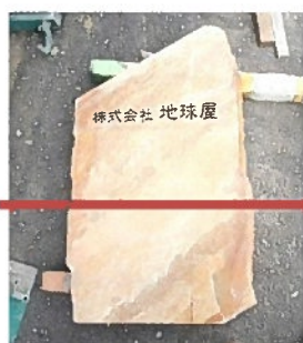
下半分を埋めます

社内だけでなく、必要な時に常日頃大変お世話になっているご近所さんにも使って頂けたら幸いです。 水道工事屋の社長さん、早速水を出して頂いてありがとうございます。とても嬉しいです！