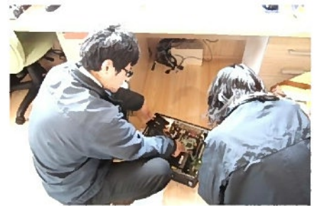
右の「もさもさ」が私です