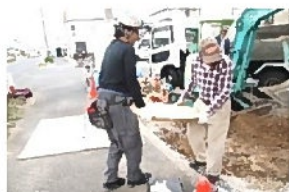
小さくても結構重たい