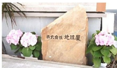
地球屋を末永く宜しくお願いします

弊社のお客様の 看板屋さんで、創って いらっしゃる石の看板！ あこがれていました！ やっと出来ました！ 予算の関係で