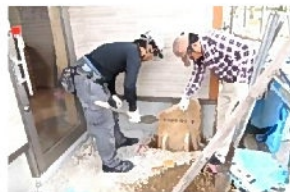
上下左右のバランス 慎重に合わせます