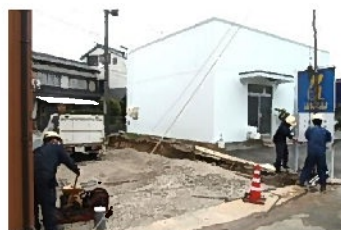
さあ、掘り始めます！

目的は花に水をやるためですが、井戸の水汲みは結構楽しいです。これで暑い夏でも思う存分、花に水をあげられます。あつてはならないですが、万一災害が起きた時でもいろいろな用途に使用できると思います。